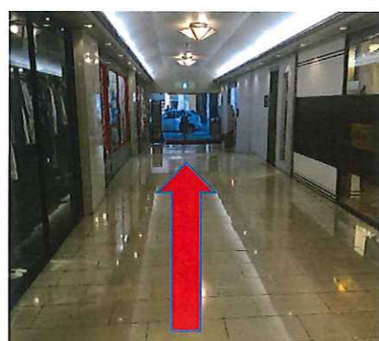
エレベーター前を芦屋駅方面に移動