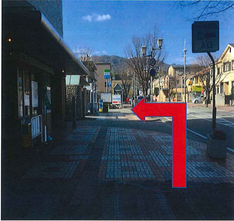
立体駐車場西側出口を西に