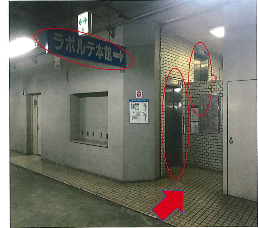
ラポルテ本館11番出口の駐車場を使い地上1階へ