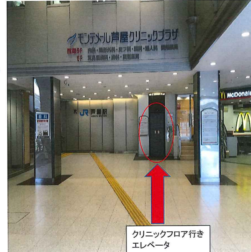
クリニックフロア行き エレベーター