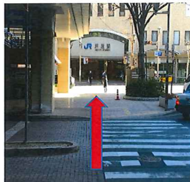
横断歩道を渡りモンテメール1階に